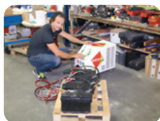
Interface et prise en main intuitive